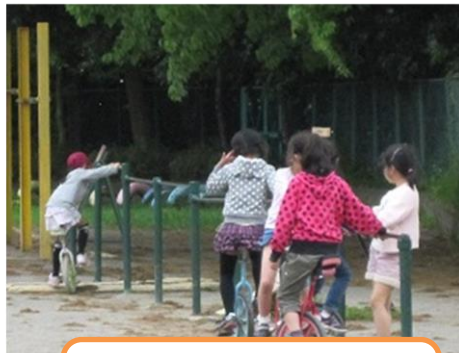
一輪車練習 必死です！