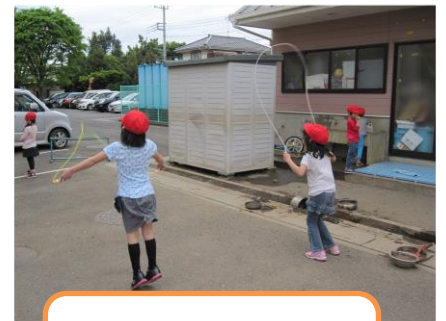
なわとびも上手です