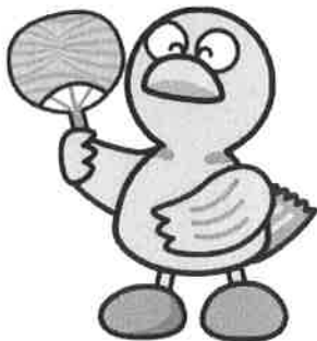
埼玉県のマスコット「コバトン」