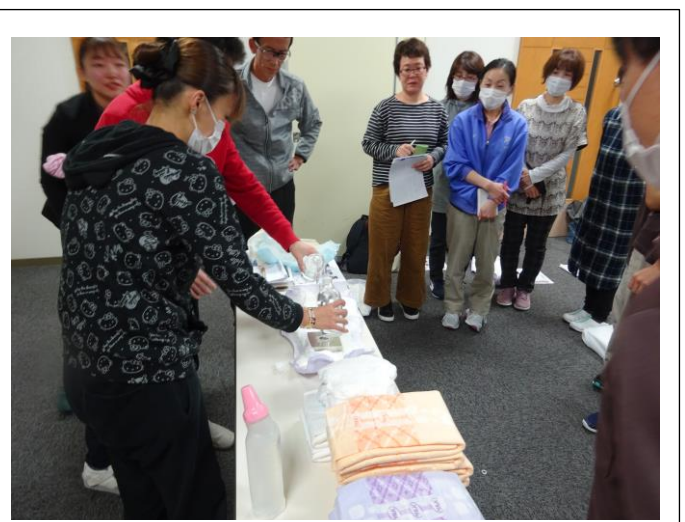
参加型の勉強会で皆さん熱心に聞いていました